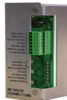
MPS48-7F Interface Module